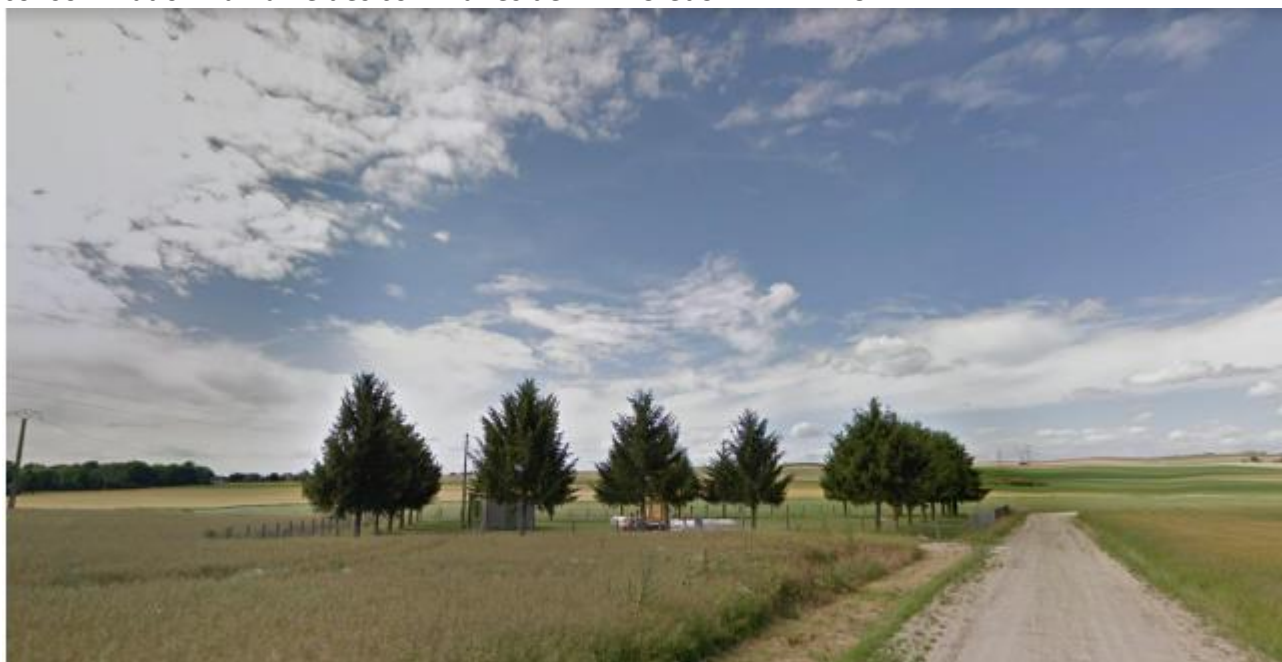
Captage « La Pultine 2 »

Le projet est soumis à quatre procédures administratives :